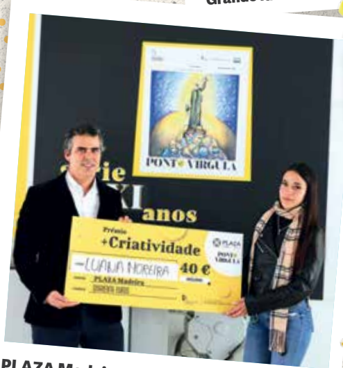
PLAZA Madeira • Prémios '+Criatividade'