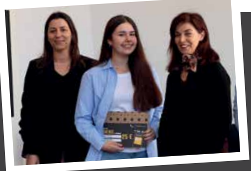
Prémios ao concurso 'A Capa do A TUA VEZ é minha'