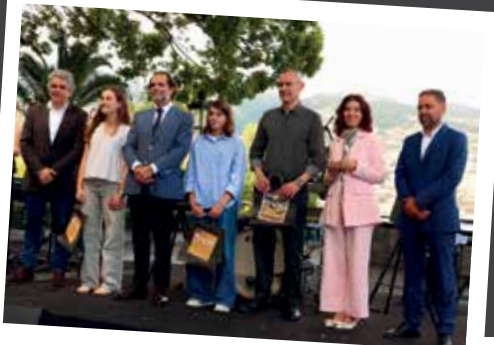
Prémios aos vencedores do concurso 'Na Ponta da Língua'