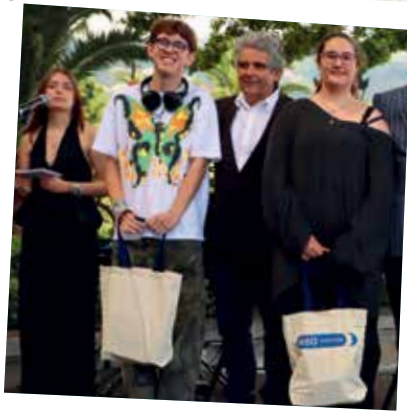
Diário de Notícias da Madeira • Menções honrosas aos participantes do Concurso 'Grande Ideia' com apoio da MEO