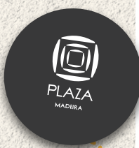
PLAZA Madeira • cartões oferta aos alunos correspondentes, vencedores, participantes e escolas do concurso 'Grande Ideia'