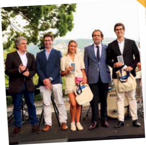
Diário de Notícias da Madeira • Prémio Supercorrespondentes