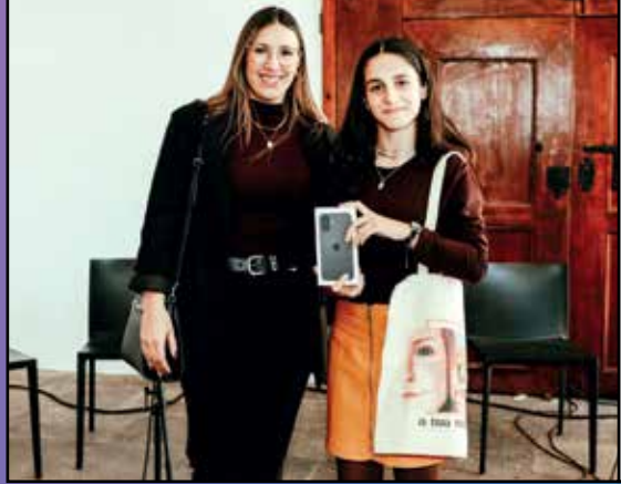
Prémio da capa mais criativa do suplemento