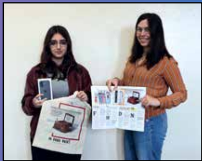
Prémios para o artigos mais criativo de cada edição do 'A Tua Vez!'