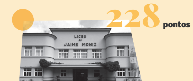
ES de Jaime Moniz (Funchal)