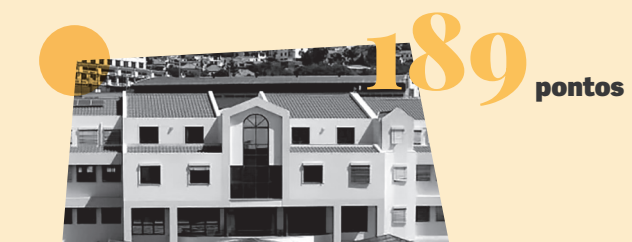
Escola da APEL (Funchal)