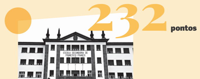
ES de Francisco Franco (Funchal)

Concurso 'Grande Ideia', que conta com a participação das 15 escolas do secundário da Região Autónoma da Madeira.